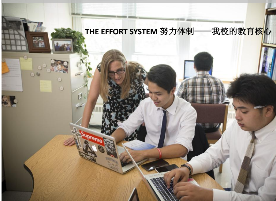
THE EFFORT SYSTEM 努力体制——我校的教育核心

男校是聪明的选择! 男子学校更利于完成我们的教育使命, 我们希望为学生提供一个单一的专注于学习的学校, 避开女孩子带给青春期男孩的压力和干扰。几年前, 这种教学方法是有争议的, 然而今天, 教育专家承认了这样一个事实: 混合学校中, 男生常常处于劣势, 而男子学校为男孩提供了独特的机会得到了社会的认可和赞扬。男孩成长方式跟女孩不同, 需要得到的教育指导方式也不同, 男子学校在培养男孩的自信心, 毅力, 自律能力都方面都非常有优势。